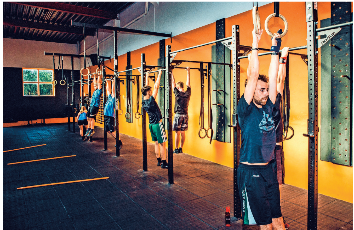
Deze club in Halle is een van de 86 plaatsen in België waar u zich kunt inschrijven voor lessen crossfit.